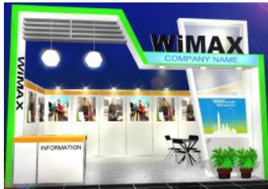
(此圖為 WiMAX Taipei 2009 主題裝潢樣式，僅供參考)